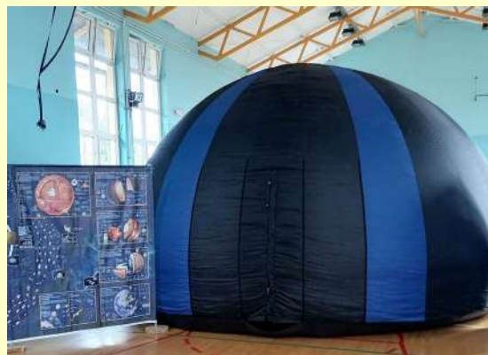
Маријана Стојановић, 5. разред